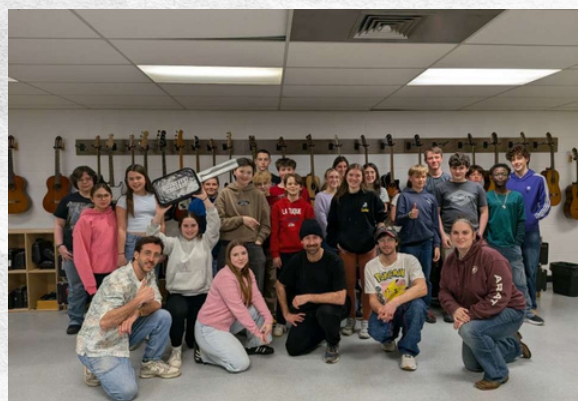
Les membres du groupe Qualité Motel, avec tous les élèves ayant participé à la classe de maître.

Merci à l'École secondaire Champagnat pour l'organisation de cet événement, et plus particulièrement à mesdames Gabrielle Anctil et Julie Sauvageau. Enfin, merci à l'organisation du Festival Le Festif! de Baie-Saint-Paul pour offrir cette opportunité aux élèves du Québec.